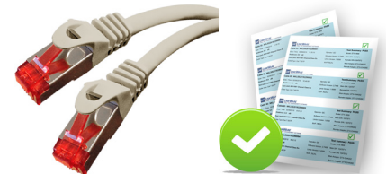
Fiche de test

Manchons anti accroc (snagless) et livrés avec fiche de test