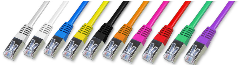
C6 FTP blindé